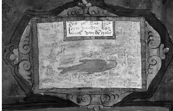
Figuur 1: De Haringkoning volgens Coenen.

Coenen beschreef de haringkoning als volgt: Onse vischers die met die harinck buysen in de Noortzee onder Englant en Schotlant en die eylande als Fayez hil (Fairhill, nu Fair Isle) en Hitlant (Shetland) om de harinck vischen nomen dese vische den koninck van den harinck en deze vische is gans root als den zeehaen (Rode Poon) en is versche gegeten den selfden smaecke als den zeehaen dan hij heeft scillen grooter dan den harinck en is bij naest dat faitsoen (vorm) dan hij ronder en dicker is. Dese vischers vangen der onder hondert duisent haringhe die sy vange eine aldus danighen Coninck. Ook heeft hij een illustratie van de Kooninck van de harinc , compleet met kroontje, in zijn boek opgenomen (foto 7).