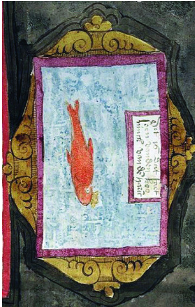
Foto 7. De Haringkoning volgens Coenen.