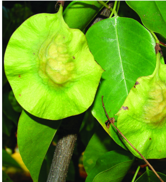
Foto 8: Intacte vrucht (peul) van Pterocarpus indicus met vleugel rondom.